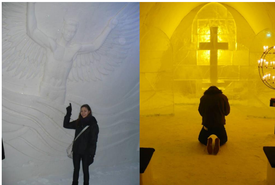
7-8. kép: Hókastély

Kemiben (Tornio melletti kisvárosban) minden évben építenek egy hókastélyt és mindig más téma alapján alakítják ki ezt a kis hóvárat. Az idei évben a sport volt a fő téma, de tavaly például a mesefilmek. Februártól áprilisig látogatható, kis kápolna és hotelszobák is találhatóak a kastélyban, s van aki itt tartja az esküvőjét, némelyek még a nászéjszakát is itt töltik el. Nagyon szép szobrokat faragtak a jégből, örültem, hogy ezt is megnézhettem.