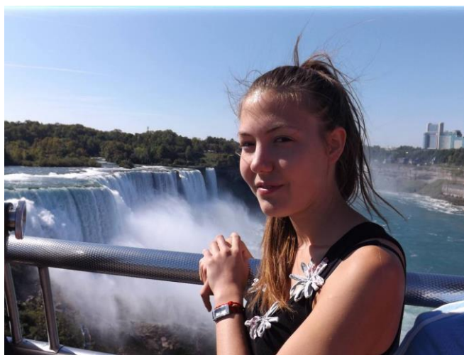
9. kép: Niagara vízesés

Kemiben (Tornio melletti kisvárosban) minden évben építenek egy hókastélyt és mindig más téma alapján alakítják ki ezt a kis hóvárat. Az idei évben a sport volt a fő téma, de tavaly például a mesefilmek. Februártól áprilisig látogatható, kis kápolna és hotelszobák is találhatóak a kastélyban, s van aki itt tartja az esküvőjét, némelyek még a nászéjszakát is itt töltik el. Nagyon szép szobrokat faragtak a jégből, örültem, hogy ezt is megnézhettem.