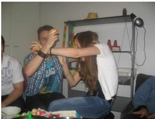
2. kép: Húsvét

mivel a cserediákok a világ minden részéről érkeztek. Találkoztam kínaiakkal, japánokkal, románokkal, franciákkal, de még dél-amerikaiakkal is. Minden kultúrába betekintést nyertem egy picit és rengeteg meghívást kaptam a világ különböző pontjára.