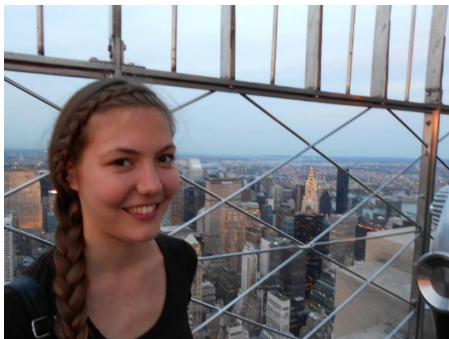
10. kép: New York

Chicago szimpatikus város, nagyon kedvesek és segítőkészek voltak az emberek. Megnéztük a Willis Towert, hajózáztunk, ahol bemutatták a híres felhőkarcolók történetét, voltunk a Millenáris parkban, illetve megnéztük a Chicago mellett található Bahai's Temple-t is.