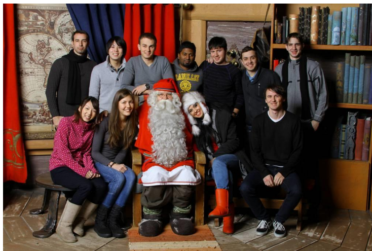
5. kép: Santa

Finnországban az első kirándulásunk alkalmával a Mikuláshoz mentünk. Hosszas vonatút vezetett hozzá, az utazás alatt megcsodálhattuk a tájat. Ez volt az első csapatkovácsoló programunk.