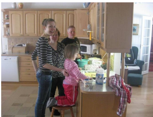
6. kép: Finn család

Finnországban az első kirándulásunk alkalmával a Mikuláshoz mentünk. Hosszas vonatút vezetett hozzá, az utazás alatt megcsodálhattuk a tájat. Ez volt az első csapatkovácsoló programunk.