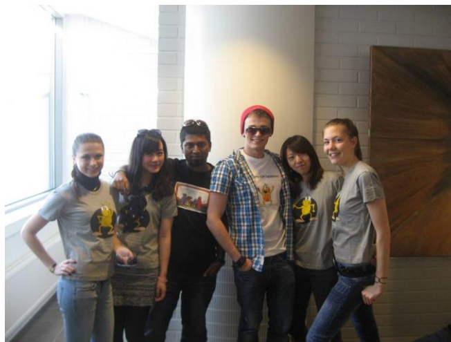
1. kép: Flash MOB

A továbbiakban képekben mutatnám be utazásaim néhány jellemző pillanatát.